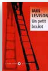
2003 Un petit boulot Adapté au cinéma