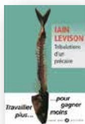
2002 Tribulations d'un précaire biographie

Faire passer un sujet grave en faisant rire n'est pas un exercice facile et Levison est tout simplement excellent, voire même génial ! Auteur de 8 romans à succès :