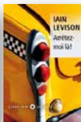
2011 Arrêtez-moi là ! Adapté au cinéma