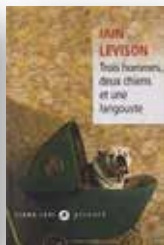
2009 Trois hommes, deux chiens et une langouste