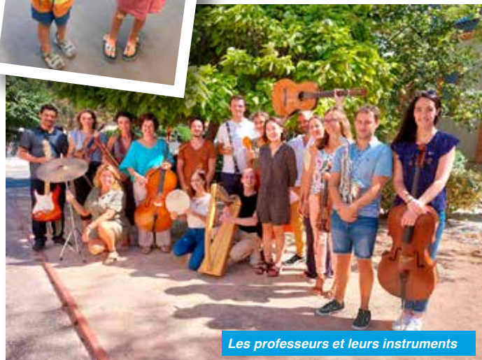
Les professeurs et leurs instruments