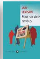
2018 Pour services rendus