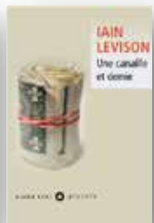
2006 Une canaille et demie Adapté au cinéma