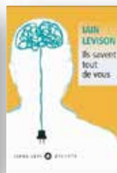
2015 Ils savent tout de vous