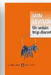
2021 Un voisin trop discret